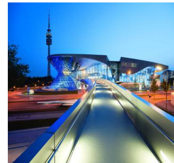
BMW WELT | MÜNCHEN