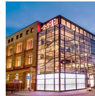
TELEKOM HAUPTSTADTREPRÄSENTANZ | BERLIN