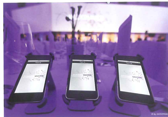
iPod touch-Geräte liegen für die Teilnehmer auf den Tischen bereit.

Audio, Video und Licht können per iPod touch oder iPad kontrolliert und gesteuert werden. Wahlweise über ein